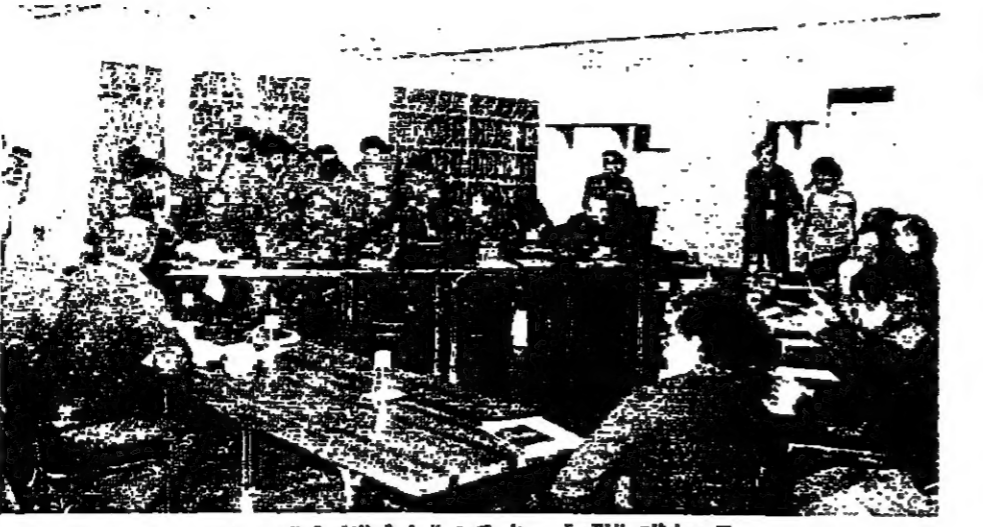
محادثات القورة... هل تكون الجلسة الأخيرة اليوم؟

لماذا تبقى خطة الساحل في السجن؟ يجب سياسي مطلع على هذا السؤال بأن المراقبين يتفكرون في مستقبل خطة الساحل من خلال الدور السوري، من دون إعطاء أهمية إلى الدور الإسرائيلي، لأن إسرائيل هي التي تتحكم بالقرار، إذا كانت سوريا تؤثر في الموقف. فإسرائيل هي التي رعت اتفاق دير الخليل، بين ممثل القوات اللبنانية والحزب الاشتراكي، والقوات الإسرائيلية هي التي تجوب أهدم الخروب، وهي التي لا تزال تمارس على لبنان سياسة القتل، لقاء الغلظة اتفاق 17 أيار، وسيره في خط المذبحة السورية.